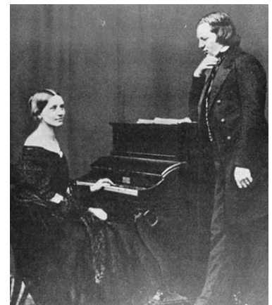
ROBERT ET CLARA SCHUMANN